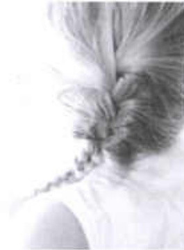
1. Французская коса