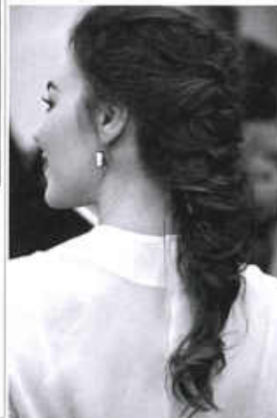
2. Обратная коса